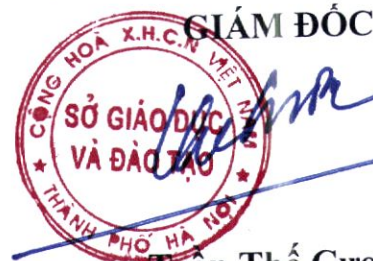
Trần Thế Cường